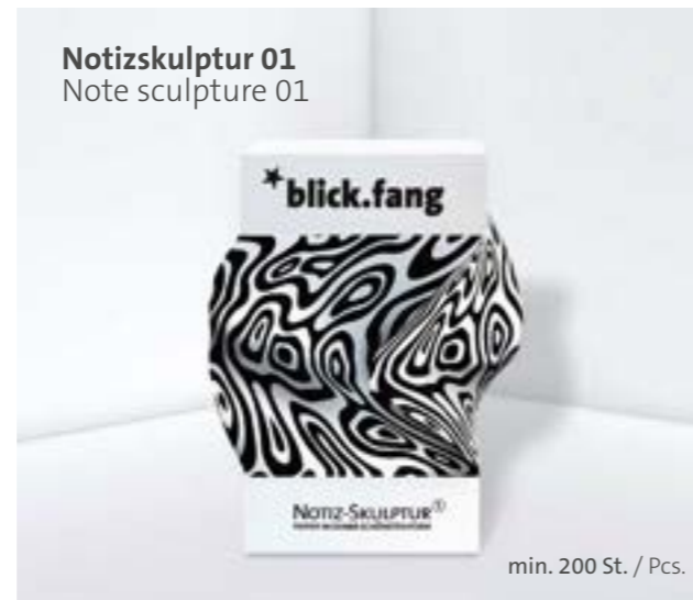
Notizskulptur 01 Note sculpture 01

Optional Einzelblattdruck 1- bis 4-farbig Offset Optional single-sheet print 1- up to 4-coloured offset