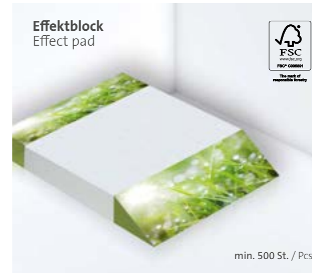
Effektblock Effect pad

Erhältlich mit bis zu vier Notizblöcken à 20 Blatt, am Fuß zusammengeleimt. Available with up to four pads, glued together at the bottom.