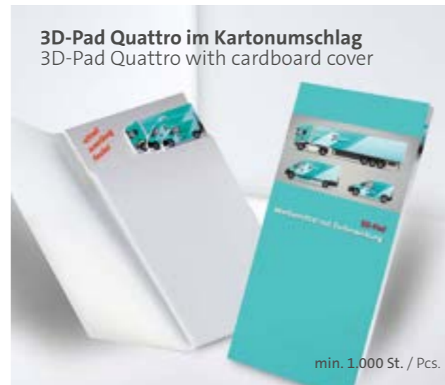
3D-Pad Quattro im Kartonumschlag 3D-Pad Quattro with cardboard cover