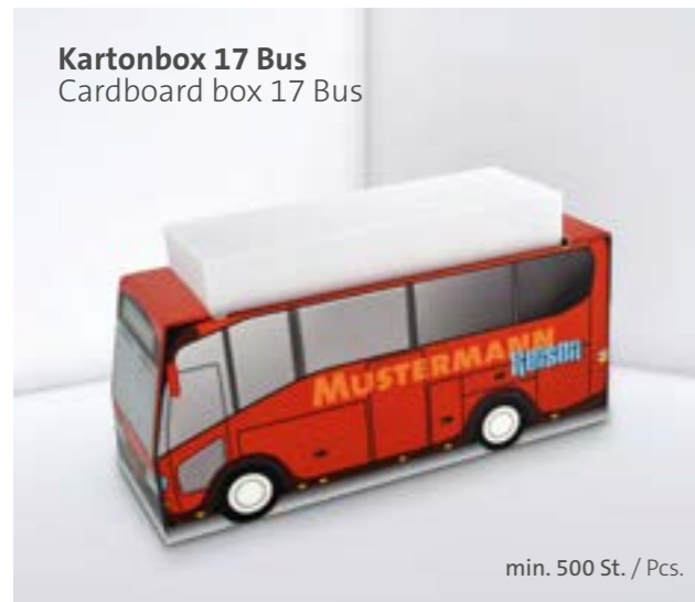
Kartonbox 17 Bus Cardboard box 17 Bus