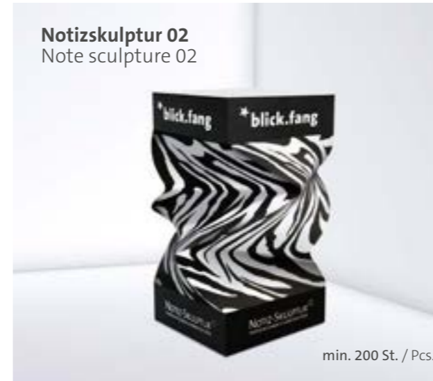
Notizskulptur 02 Note sculpture 02