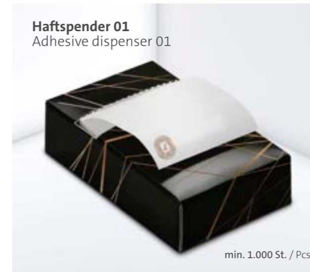
Haftspender 01 Adhesive dispenser 01