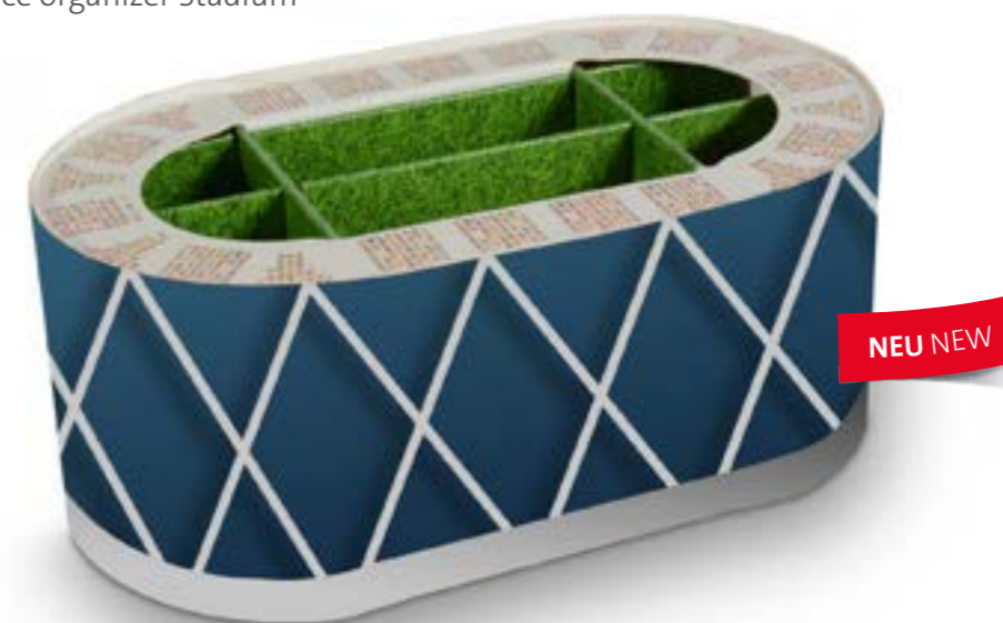
Office Organizer Stadion Office organizer Stadium