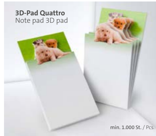
3D-Pad Quattro Note pad 3D pad

Erhältlich mit bis zu drei Notizblöcken à 20 Blatt, am Fuß zusammengeleimt. Available with up to three pads, glued together at the bottom.