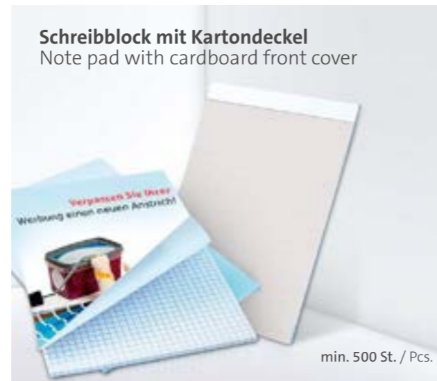
Schreibblock mit Kartondeckel Note pad with cardboard front cover