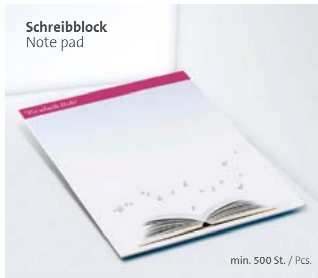
Schreibblock Note pad