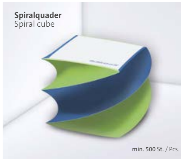
Spiralquader Spiral cube

Extra clever. The full-bleed printing on the individual sheets becomes visible on the pages when the block is twisted. This creates beautiful colour accents even without cutting edge printing.