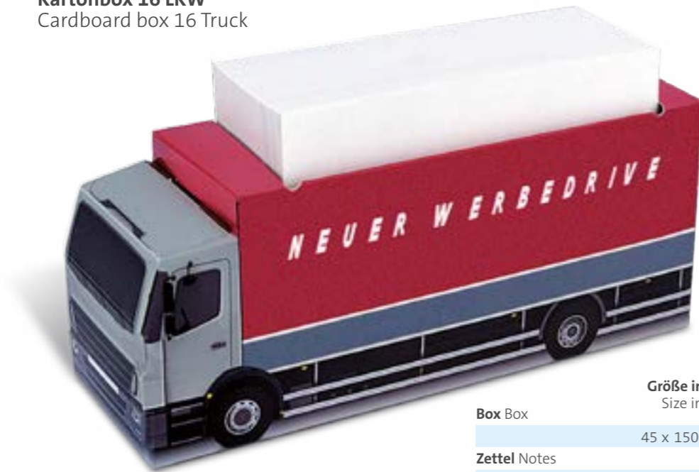
Kartonbox 16 LKW Cardboard box 16 Truck