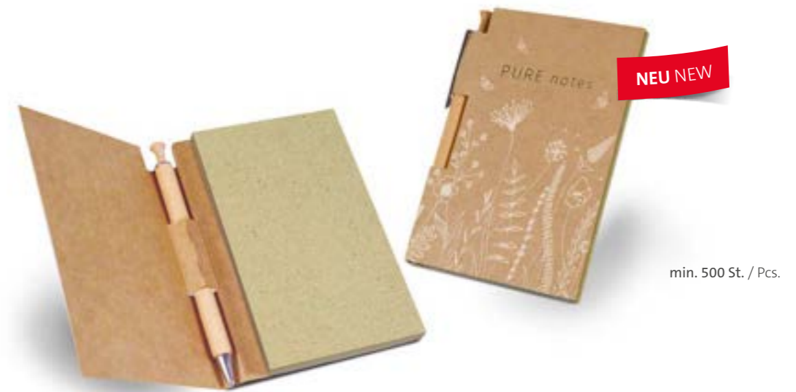
Pad & Pen 01 Natural Pad & pen 01 natural