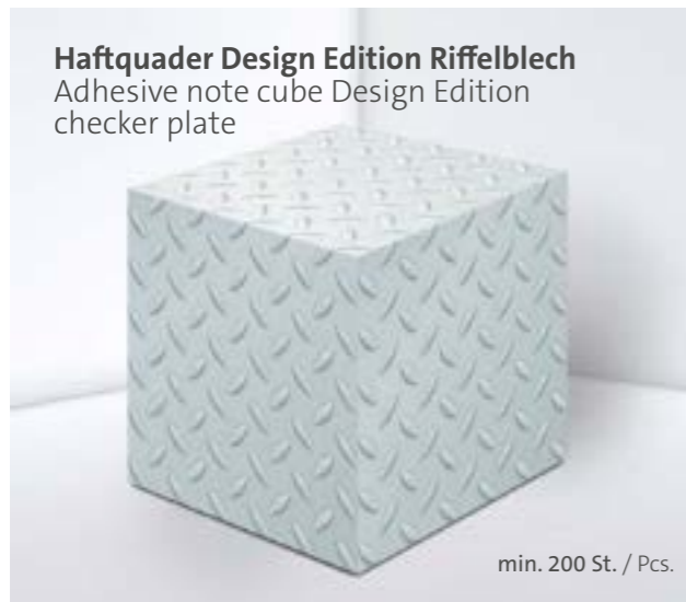
Haftquader Design Edition Riffelblech Adhesive note cube Design Edition checker plate