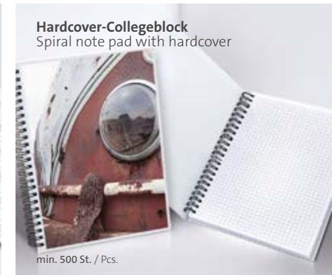
Hardcover-Collegeblock Spiral note pad with hardcover