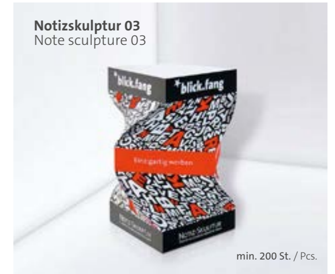
Notizskulptur 03 Note sculpture 03

Optional Einzelblattdruck 1- bis 4-farbig Offset Optional single-sheet print 1- up to 4-coloured offset