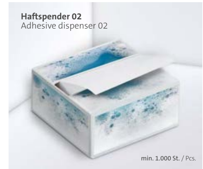
Haftspender 02 Adhesive dispenser 02