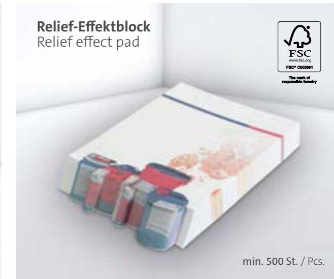
Relief-Effektblock Relief effect pad