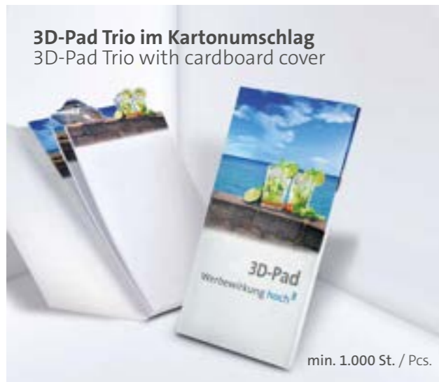
3D-Pad Trio im Kartonumschlag 3D-Pad Trio with cardboard cover