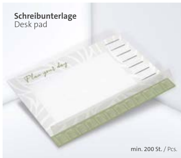
Schreibunterlage Desk pad

Ohne Kugelschreiber, optional mit gestelltem Kugelschreiber erhältlich Without ballpoint pen, optionally available with a posed ballpoint pen