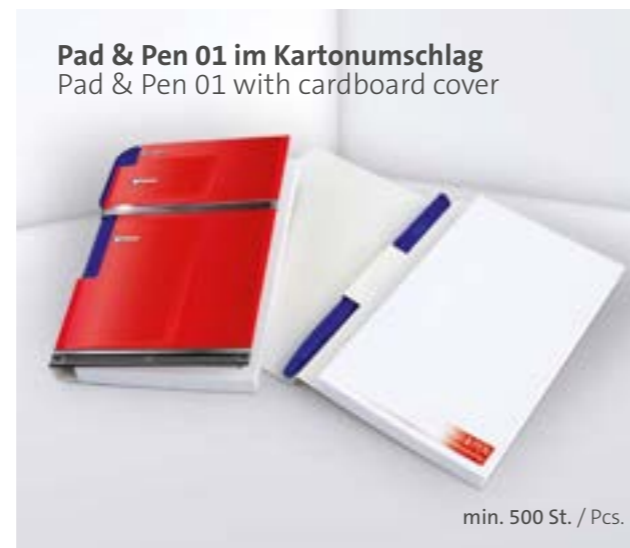
Pad & Pen 01 im Kartonumschlag Pad & Pen 01 with cardboard cover

Optional mit transparenter oder weißer Kunststoffleiste Optional with transparent or white plastic border