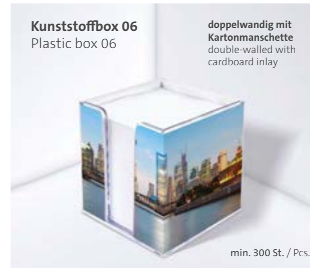
Kunststoffbox 06 Plastic box 06

doppelwandig mit Kartonmanschette double-walled with cardboard inlay