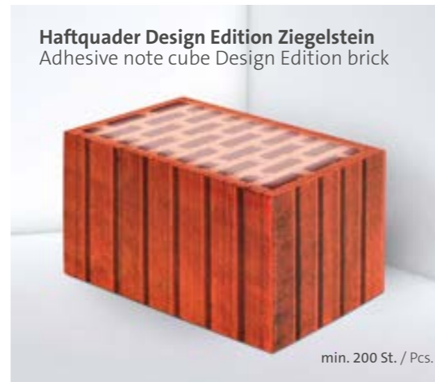
Haftquader Design Edition Ziegelstein Adhesive note cube Design Edition brick