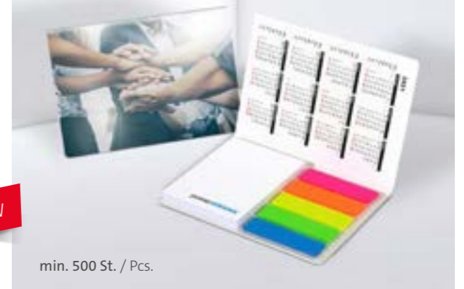
Haftset 01 mit Kunststoffmarkerset Adhesive set 01 with plastic marker set