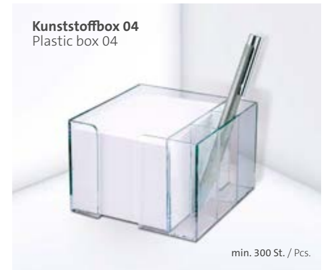
Kunststoffbox 04 Plastic box 04

Weitere Größen auf Anfrage Other sizes on request