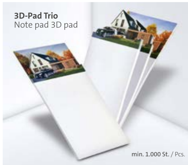
3D-Pad Trio Note pad 3D pad