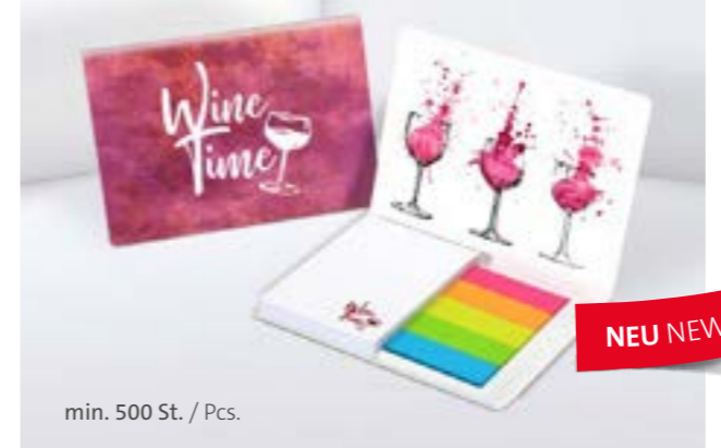
Haftset 01 mit Papiermarkerset Adhesive set 01 with paper marker set

Our support for your grey cells looks bright and colourful. With our popular marker sets, you always have the right little helpers ready to hold important information at hand. Whether made entirely of sustainable paper or with the traditional strips of plastic, printed in the classic neon or in your own corporate colours – it's up to you to decide.