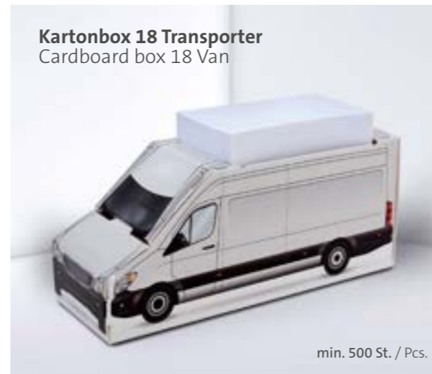
Kartonbox 18 Transporter Cardboard box 18 Van

Individuelle Formen auf Anfrage Individual shapes on request