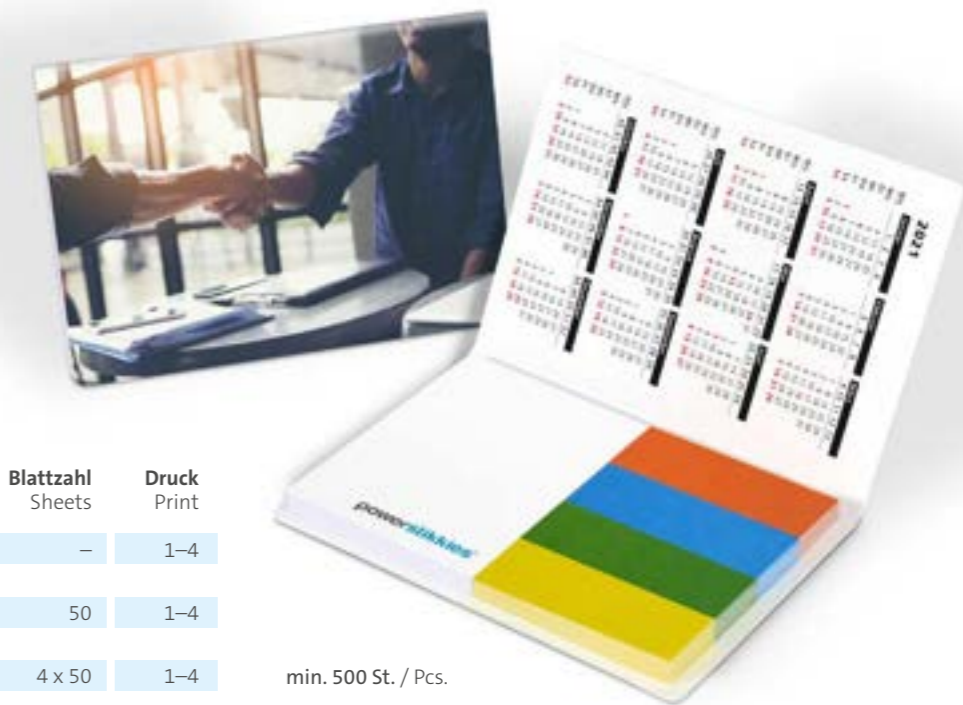
Haftset 01 mit individualisierbaren Papiermarkern Adhesive set 01 with individual paper marker