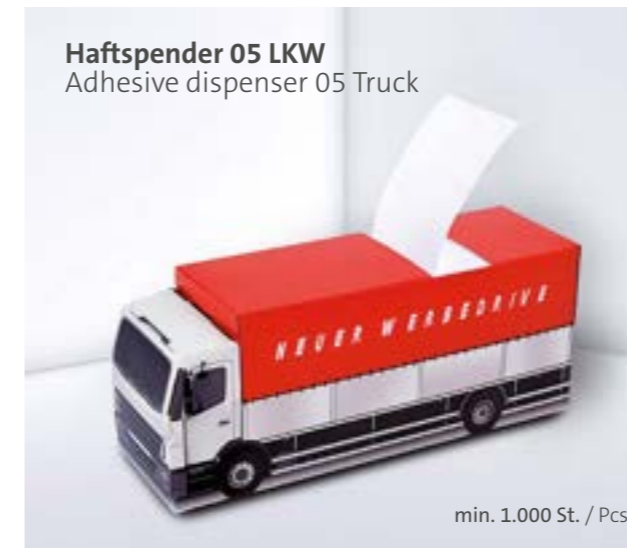
Haftspender 05 LKW Adhesive dispenser 05 Truck

Adhesive notes are a classic that are often used professionally and privately. With custom printing, we can turn this inexpensive standard item into your coveted giveaway. Use the surface of our sticky notes for your logo and design and stay in the eye with your advertising message sheet by sheet or even on the cover.