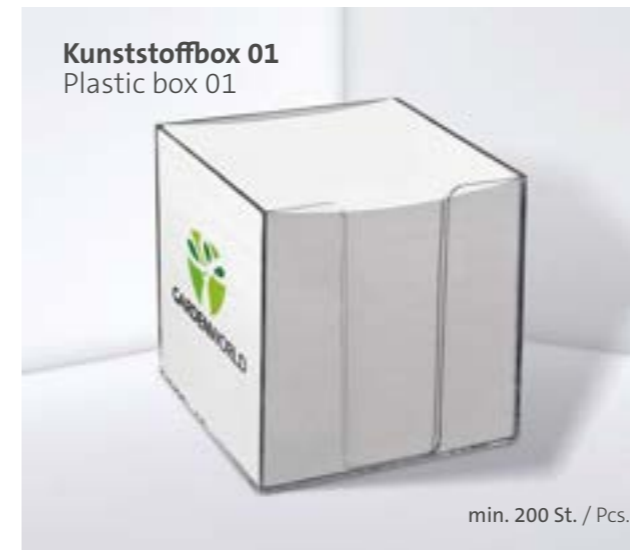
Kunststoffbox 01 Plastic box 01

Individuelle Formen auf Anfrage Individual shapes on request