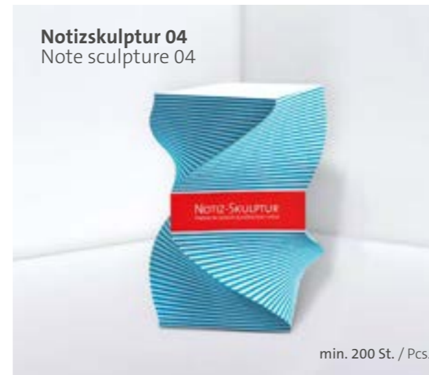
Notizskulptur 04 Note sculpture 04

Optional Einzelblattdruck 1- bis 4-farbig Offset Optional single-sheet print 1- up to 4-coloured offset