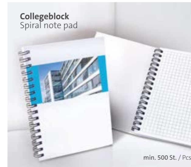
Collegeblock Spiral note pad