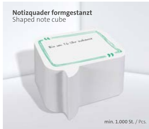
Notizquader formgestanzt Shaped note cube

Optional Einzelblattdruck 1- bis 4-farbig Offset Optional single-sheet print 1- up to 4-coloured offset