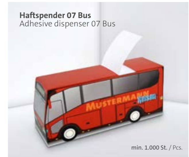
Haftspender 07 Bus Adhesive dispenser 07 Bus

Unterstrichenes Maß = Haftseite Underlined dimension = Adhesive side