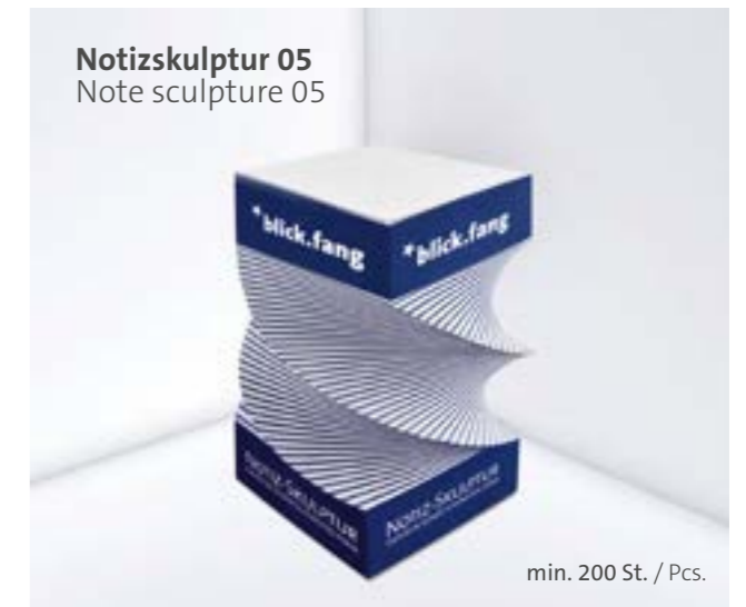
Notizskulptur 05 Note sculpture 05

Optional Einzelblattdruck 1- bis 4-farbig Offset Optional single-sheet print 1- up to 4-coloured offset